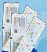
専用の 4連保冷剤 2セット