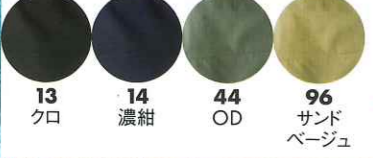
13 クロ 14 濃紺 44 OD 96 サンドベージュ