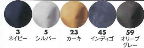
3 ネイビー 5 シルバー 23 カーキ 45 インディゴ 59 オリーブグレー